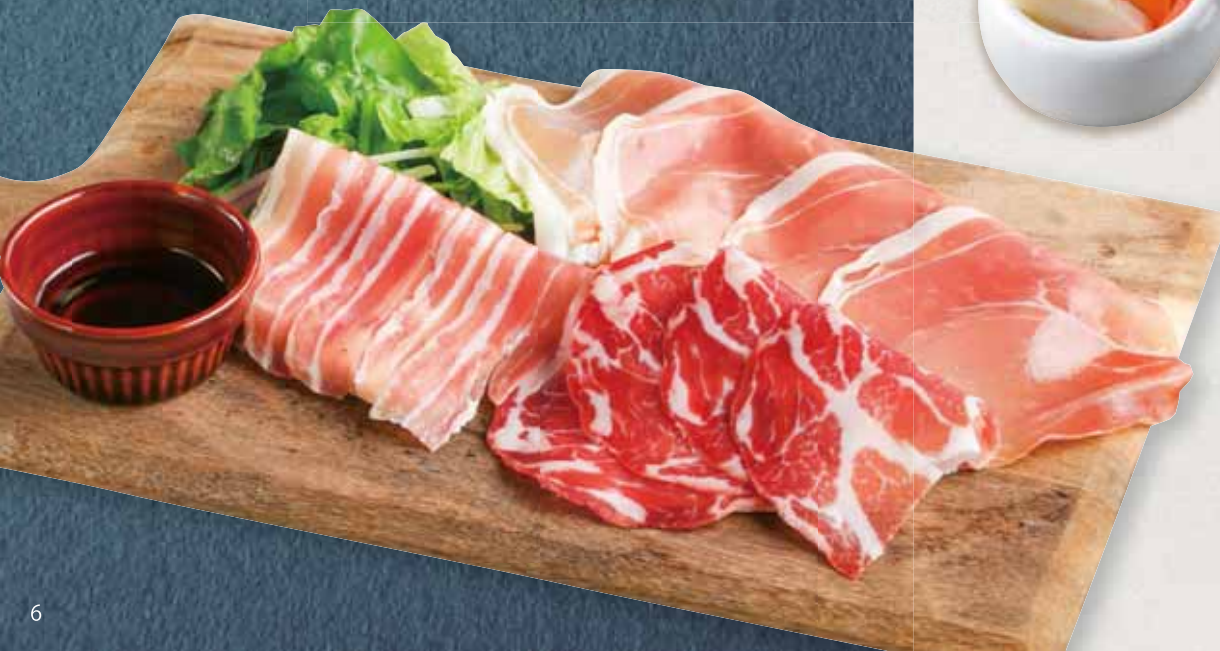
生ハムの盛り合わせ Assorted Uncured Ham