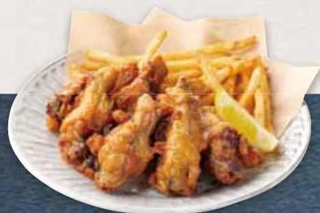
香草チキンウィング Herb Chicken Wings ¥880(税込)