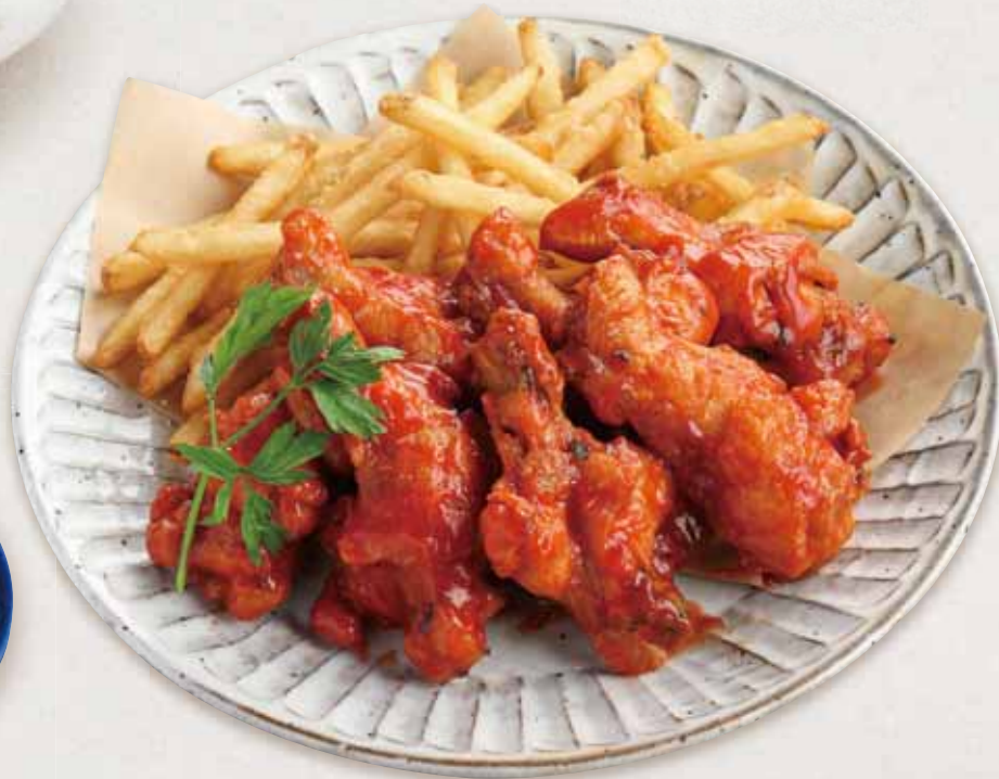
バッファローチキンウィング Buffalo Wings ¥880(税込)