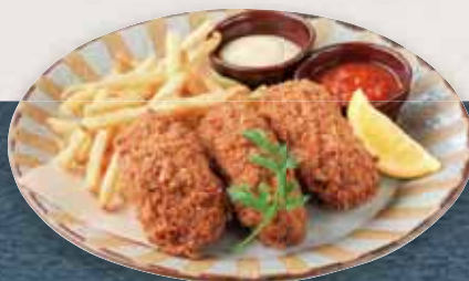
カキフライ&ポテト Deep Fried Oyster & French Fries ¥980(税込)