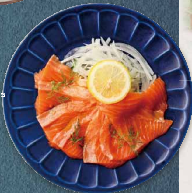
生サーモンの 塩糰カルパッチョ Salmon Carpaccio with Shio Koji