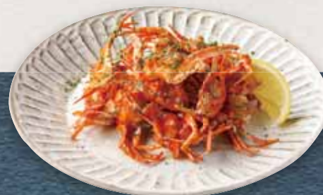
クリスピークラブフリット Crispy Crab Frit ¥780(税込)