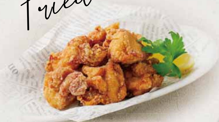
米粉のカリッと唐揚げ Rice Crispy Fried Chicken ¥680(税込)