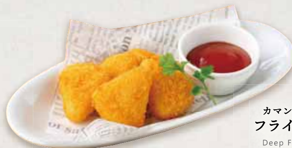
カマンベール入り フライドチーズ Deep Fried Cheese ¥580(税込)