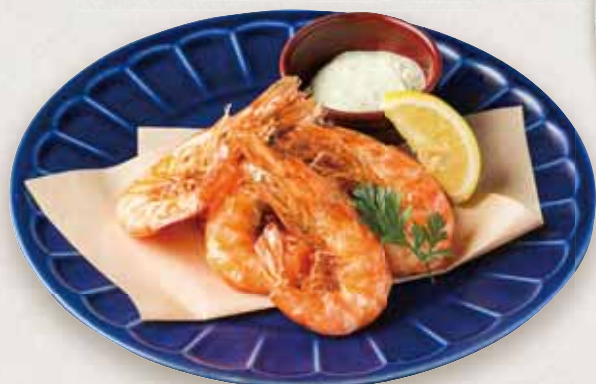
ソフトシェルシュリンプ Deep Fried Soft Shell Shrimp ¥880(税込)