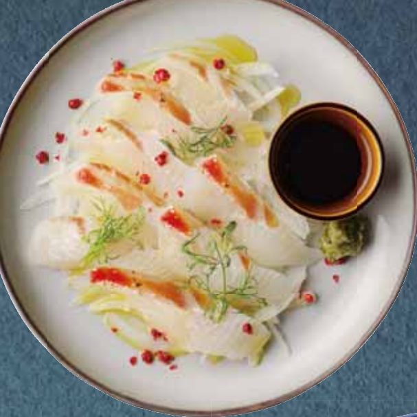
真鯛の 和風カルパッチョ Red Sea Bream Carpaccio -Japanese Style-